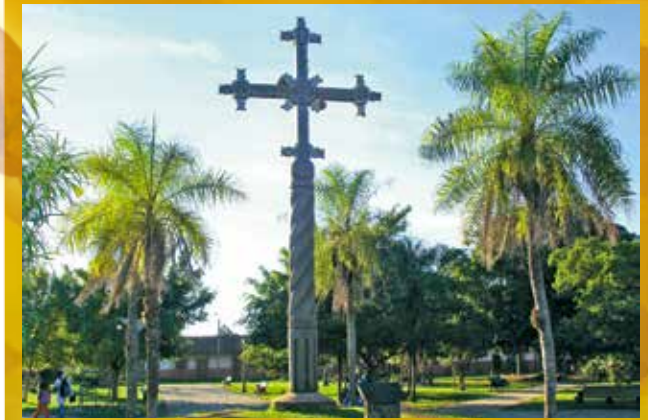
(Plaza principal de san Javier-Santa Cruz de la Sierra, Bolivia)

Esta Cruz prosigue impulsando la evangelización de los pueblos de la Chiquitania boliviana. Con la misma fuerza y encanto, ella acompañará nuestro andar misionero de nuestras del continente americano.